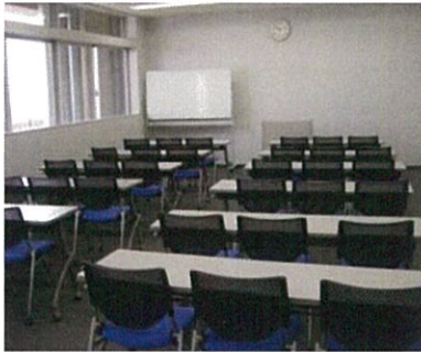
研修室 1 定員40名 (約77㎡)