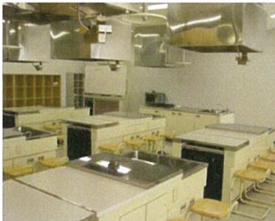
実習室 定員40名 (約95㎡)

各種調理器具や食器、水道、ガスレンジなどを備えており、実験や調理などを行うことができます。 ※排気ダクトの構造上、ご利用に堪えない場合もございます。予約時にご確認ください。