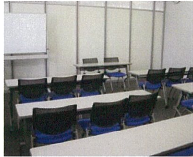
研修室 2 定員20名 (約38㎡)

少人数の打合せやサークル活動に最適な会議室です。 ※研修室1とつなげて使用することも可能です。